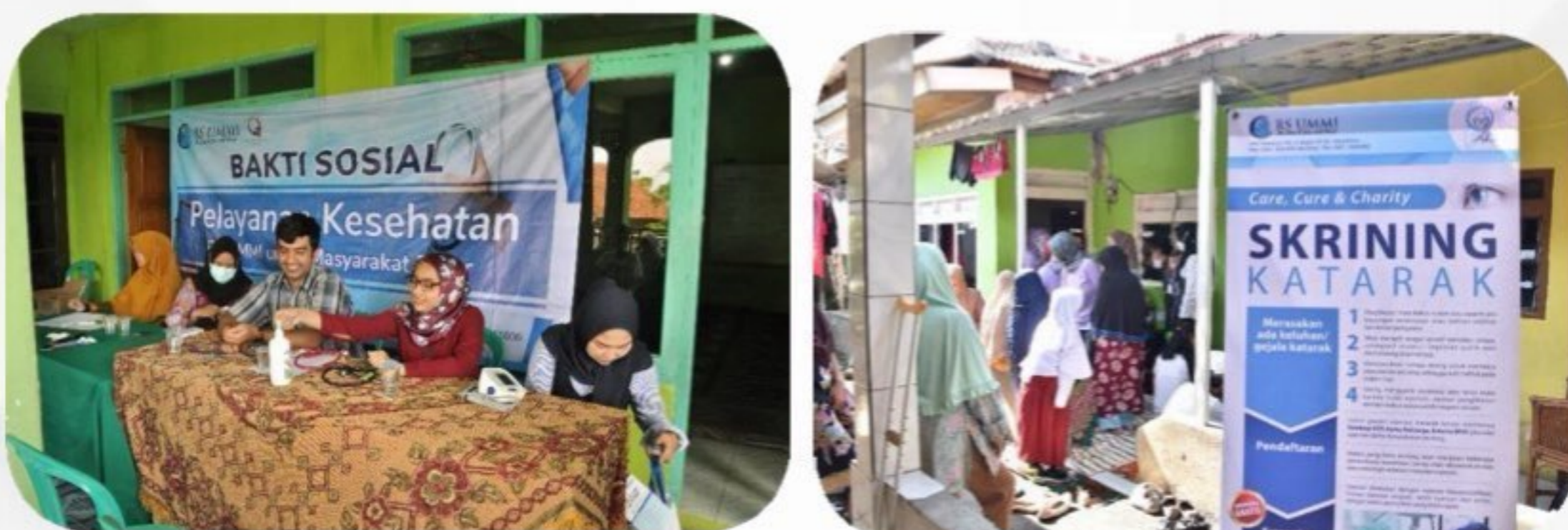
Gambar 3 Kegiatan bakti sosial & skrining katarak

Melalui program Safari Health Care , RS UMMI secara massif menyentuh seluruh lapisan masyarakat dan mulai mengikis pola pikir bahwa rumah sakit swasta, khususnya RS UMMI tidak selalu komersil dan membedakan pasien dalam melakukan pelayanan kesehatan. Hasil dari kegiatan sosial RS UMMI tersebut, saat ini sudah banyak masyarakat Kota Bogor yang derajat kesehatannya mengalami peningkatan dan mulai mempercayakan pelayanan kesehatannya di RS UMMI. Hal ini dapat dilihat dari perkembangan jumlah kunjungan pasien RS UMMI dari tahun ke tahunnya.