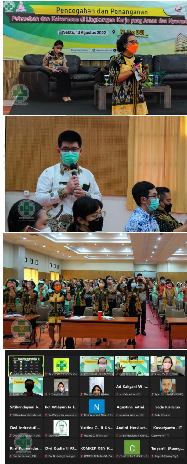
Gambar 2. Dokumentasi kegiatan Seminar hybrid