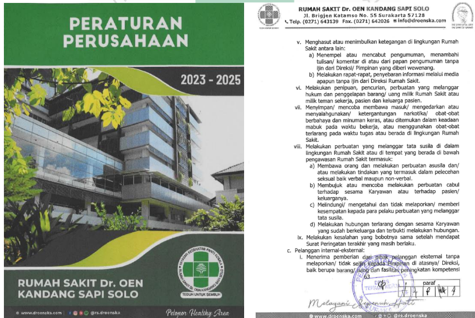
Gambar 1. Dokumen Peraturan Perusahaan

Secara umum perilaku seluruh karyawan diatur pada peraturan perusahaan dan dijelaskan lebih detail antara lain pada panduan etik dan perilaku rumah sakit, etika pelayanan, etika profesi kedokteran, dan etika keperawatan. Tidak berhenti pada pembuatan regulasi, RUMAH SAKIT Dr.OEN KANDANG SAPI SOLO yang memperhatikan permasalahan kekerasan dan pelecehan seksual melakukan upaya lain diantaranya, sosialisasi mengenai kekerasan dan pelecehan di tempat kerja dan peningkatan sistem pelaporan insiden.