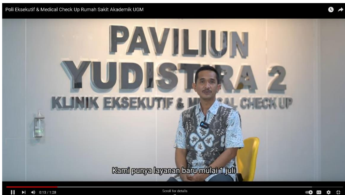
Gambar 1. Poli eksekutif RSA UGM ( https://youtu.be/osuQukyf-WY?si=0Ik1w0ntAoccF7eP )

Jenis pelayanan kesehatan tambahan diberikan paling banyak 2 (dua) kali dalam 1 (satu) bulan termasuk layanan telemedicine paling banyak 1 (satu) kali dalam 1 (satu) bulan. Semua pelayanan dilakukan pada 1 ruangan poli eksekutif mulai dari pemeriksaan oleh dokter spesialis, pengambilan darah dan urin untuk pemeriksaan laboratorium patologi klinik, pemeriksaan USG, rontgen, echo dan treadmill . Selama menunggu pasien diberikan welcome gift berupa makanan sehat, buah dan jamu buatan instalasi gizi RSA UGM (jamu beras kencur, jamu kunyit asam, jamu bunga telang, jamu wedang uwuh semuanya rendah gula).