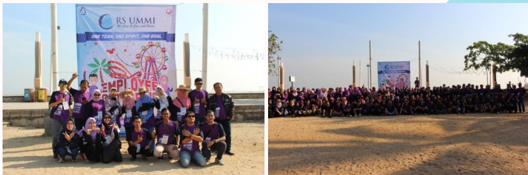
Gambar 2. Kegiatan Employee Gathering ke Dufan