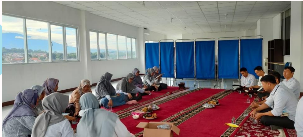
Gambar 8. Kajian Halaqoh Harian Setiap Pagi