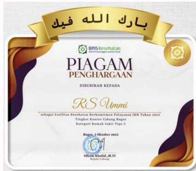
Gambar 14 Piagam Penghargaan dari BPJS sebagai Faskes Berkomitmen tahun 2023

Dari Langkah-langkah yang telah dilakukan sebagai upaya untuk meningkatkan kinerja karyawan dengan cara mensejahterakan karyawan sehingga terpenuhinya Kesehatan jasmani dan Kesehatan rohani telah membuahkan hasil dimana RS UMMI Bogor di bulan Oktober 2023 mendapatkan penghargaan dari BPJS Kesehatan sebagai Fasilitas Kesehatan Berkomitmen Pelayanan JKN tahun 2023.