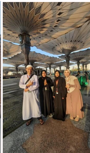
Gambar 7. Penghargaan Kepada Karyawan Untuk Melaksanakan Ibadah Umroh