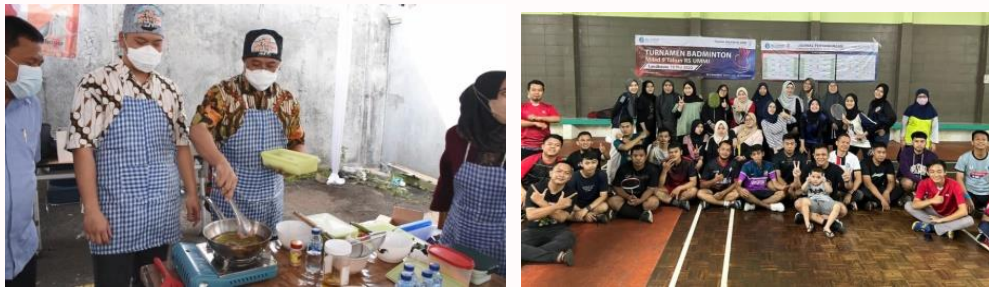
Gambar 5. Partisipasi Dokter Spesialis dalam Kegiatan Milad RS UMMI