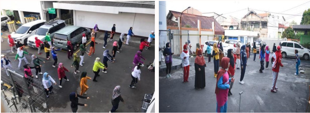
Gambar 4. Kegiatan Senam Jantung Sehat