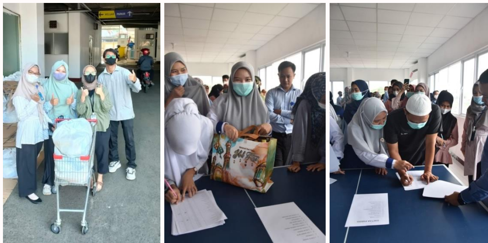
Gambar 10. Antusiasme Karyawan Saat Pembagian Sembako dan Parsel