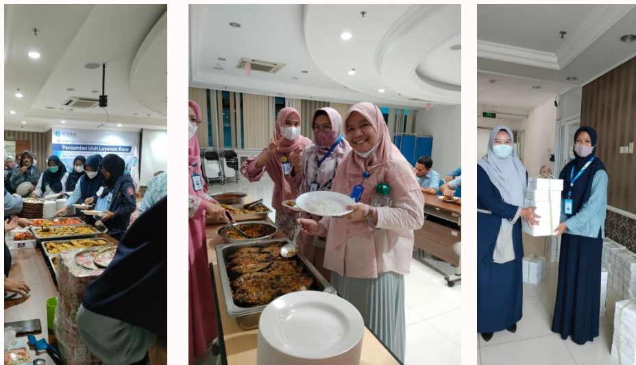
Gambar 1. Kegiatan Makan Rabu Bersama Karyawan