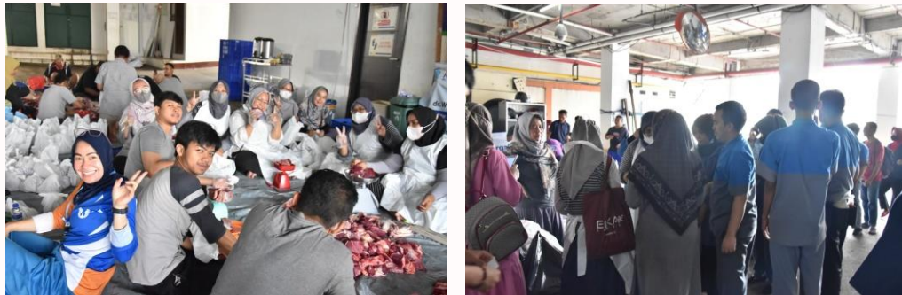
Gambar 9. Pemotongan dan Pembagian Daging Qurban kepada Karyawan