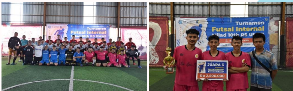
Gambar 6. Partisipasi Karyawan dalam Kegiatan Milad RS UMMI