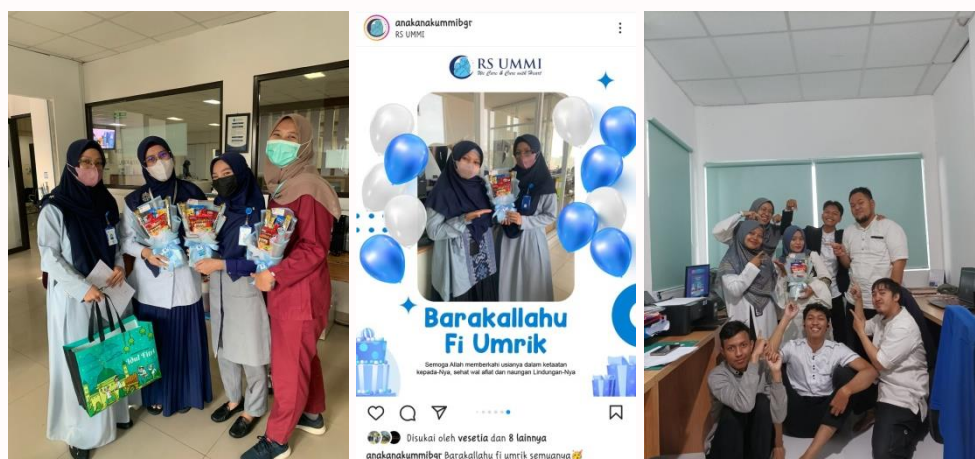
Gambar 13. Pembagian Bucket Snack kepada Karyawan

16. Memberikan bucket snack kepada karyawan yang berulang tahun