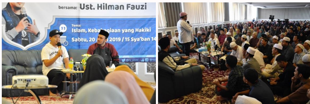
Gambar 12. Kajian Islam dari Pemuka Agama untuk karyawan

14. Kajian bulanan untuk seluruh karyawan (baik secara offline dan online )