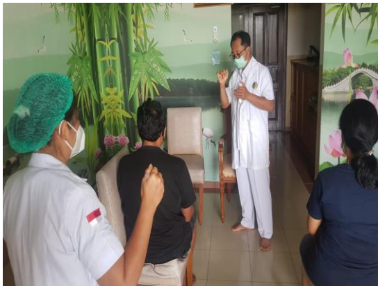
Terapi prana on site