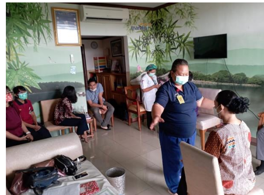
Terapi prana on site