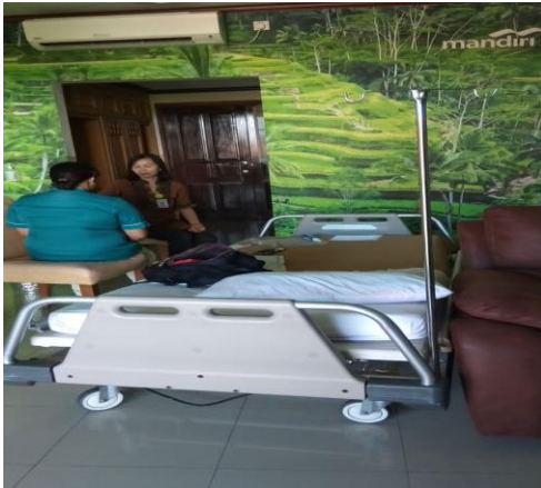
Konseling pada perawat yang akan bertugas di Ruang Isolasi Covid-19

Inovasi ini telah berhasil membentuk healing clinic berupa layanan konseling, psikoterapi, terapi prana dan meditasi bersama. Healing clinic ini merupakan model peningkatan kesejahteraan fisik dan mental staf terutama saat krisis.