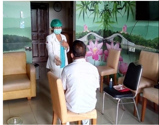
Psikoterapi pada perawat yang bertugas di Ruang Covid-19