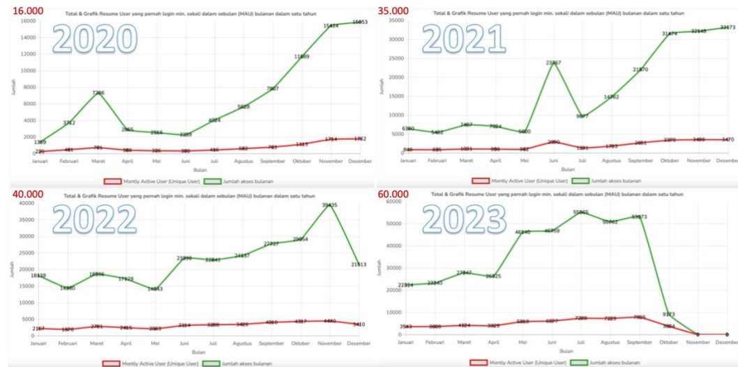
Diagram 1. Jumlah pengguna dan pengguna aktif MPDN (data diunduh 04 Oktober 2023 jam 07.30)

Terjadi tren peningkatan jumlah pengguna dan pengguna aktif, seperti digambarkan pada Diagram 1. Pengguna MPDN juga sudah meliputi 514 Kabupaten/Kota. Masih perlu ditingkatkan adalah pengguna aktif yang melaporkan menggunakan MPDN.