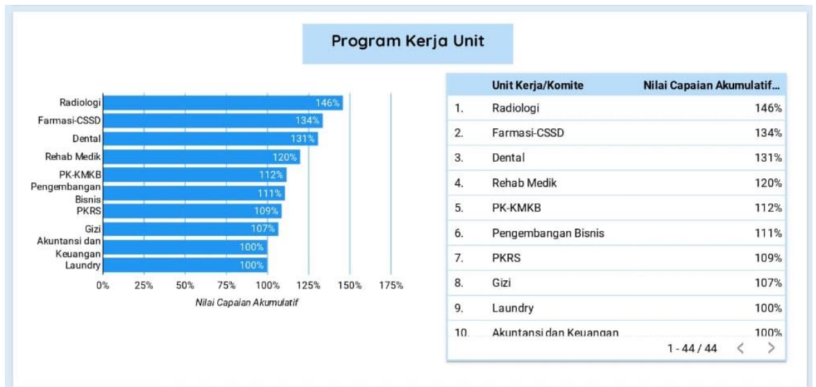
Gambar 5. Tampilan presentase capaian kinerja unit kerja